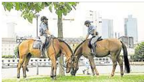
Da wird's einem schon beim Anblick gleich viel kühler: Tauchereinsatz für saubere Scheiben im Robben-Becken des Frankfurter Zoos.

Ganz oben auf dem Maßnahmenkatalog bei dieser Hitze steht: trinken, trinken! Am besten Mineralwasser oder ungezuckerten Tee. Der Flüssigkeitsverlust durchs Schwitzen muss unbedingt ausgeglichen werden, um Kreislaufprobleme zu vermeiden. Ebenso wichtig: Für ausreichenden Schutz der Haut vor der starken Sonneneinstrahlung sorgen!