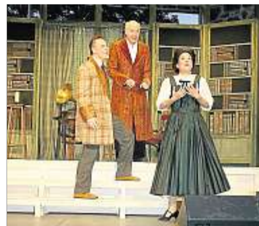
Freilichttheater – so muss Sommer sein.

75014325 anruft, hat Chancen auf Tickets für „Don Camillo“ (25. Juli, 18.15 Uhr), für „My Fair Lady“ (12. August, 20.15 Uhr), für „Die Räuber“ (18. August, 20.15 Uhr), für „Kalender Boys“ (21. Juli, 20.15 Uhr) und für die Musikrevue „Je schöner der Schlager“ (21. August, 20.15 Uhr). Bitte beachten Sie: Wer zuerst kommt, mahlt zuerst! Die ersten fünf Anrufer bekommen Karten für „Don Camillo“ und so weiter. Sich an der Gewinnhotline ein Stück auszusuchen, ist leider nicht möglich. Viel Glück! apr